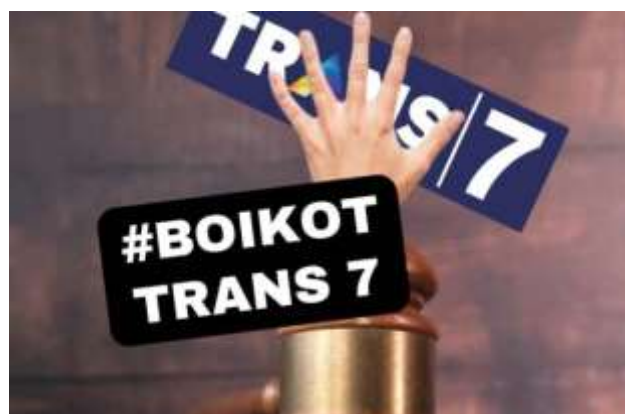
Gambar 2. Ajakan Boikot Trans 7

Media seharusnya berperan sebagai sarana edukasi dan kontrol sosial yang sehat. Ketika media gagal menjalankan fungsi tersebut, maka media tidak hanya melanggar etika profesional, tetapi juga mengabaikan tanggung jawab sosialnya kepada publik.