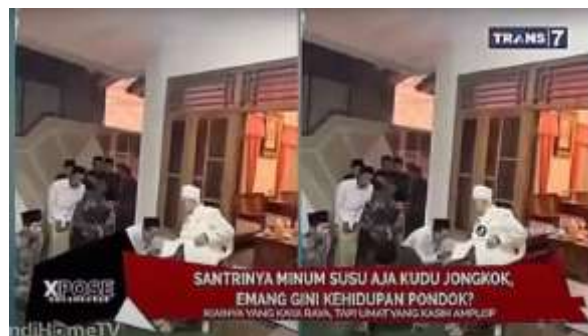
Gambar 1. Siaran Trans 7

Kasus pelanggaran etika jurnalistik yang dilakukan oleh Trans7 dalam pemberitaan mengenai Pesantren Lirboyo menjadi salah satu isu komunikasi yang banyak dibahas dalam ranah media dan publik. Tayangan yang menampilkan pesantren sebagai tempat yang diasosiasikan dengan praktik kekerasan atau penyimpangan moral memicu reaksi keras dari masyarakat, khususnya kalangan pesantren. Banyak pihak menilai bahwa pemberitaan tersebut tidak memperhatikan prinsip-prinsip dasar dalam Kode Etik Jurnalistik, terutama terkait akurasi, keberimbangan informasi, dan penghormatan terhadap martabat narasumber.